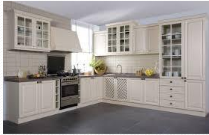
Mobilya ve İç Mekan Tasarımı