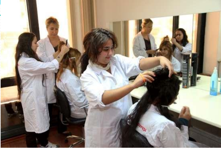
Güzellik ve saç bakımı hizmetleri