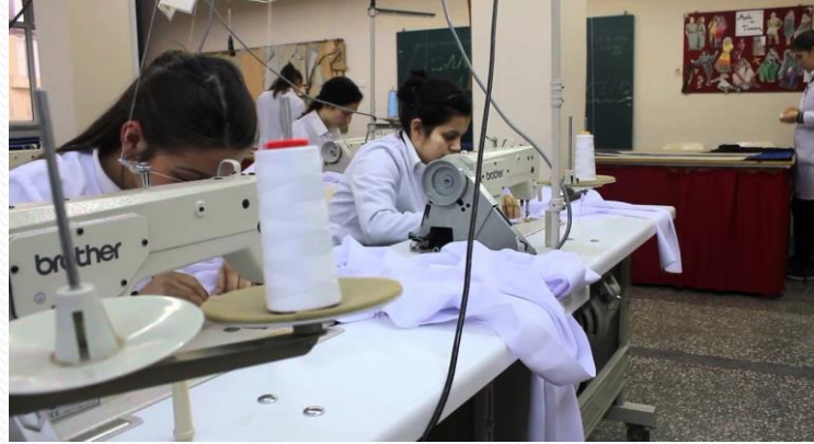
Giyim Üretim Teknolojisi