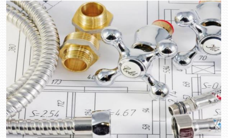
Tesisat Teknolojisi ve İklimlendirme