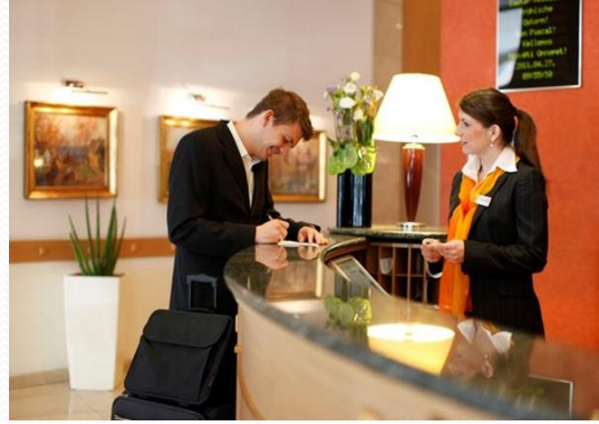
Konaklama ve Seyahat Hizmetleri