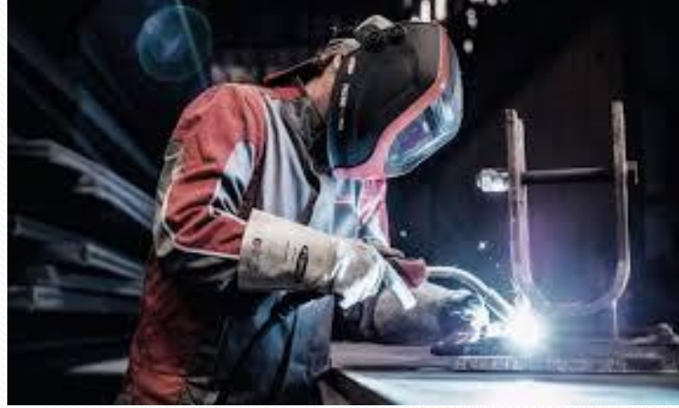
Metal Teknolojisi Kaynakçı