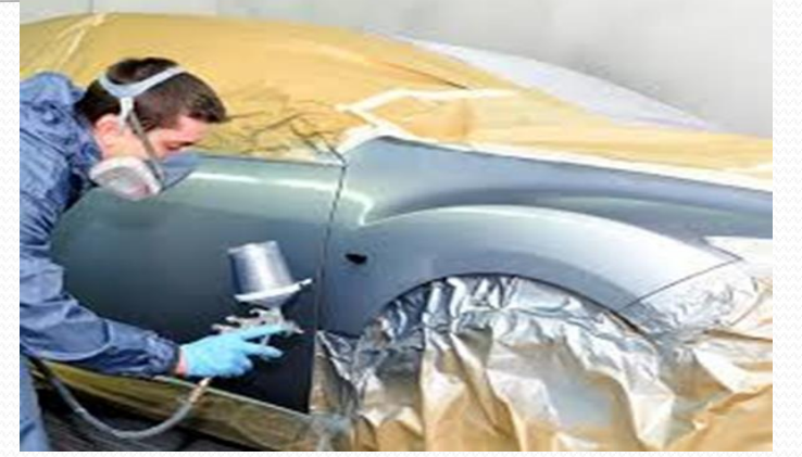
Motorlu Araçlar Teknolojisi Oto Boya