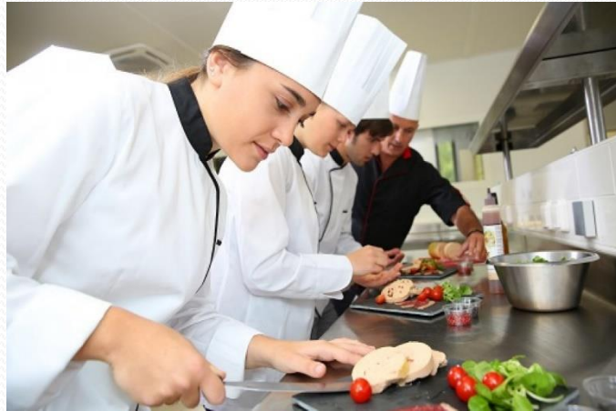
Yiyecek ve İçecek Hizmetleri