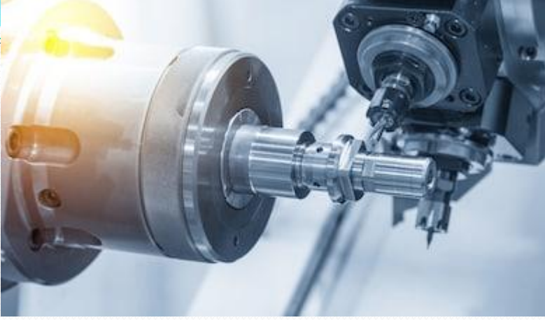
Makine Teknolojisi CNC