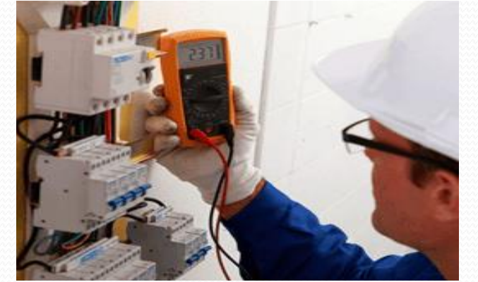
Elektrik Elektronik Teknolojileri